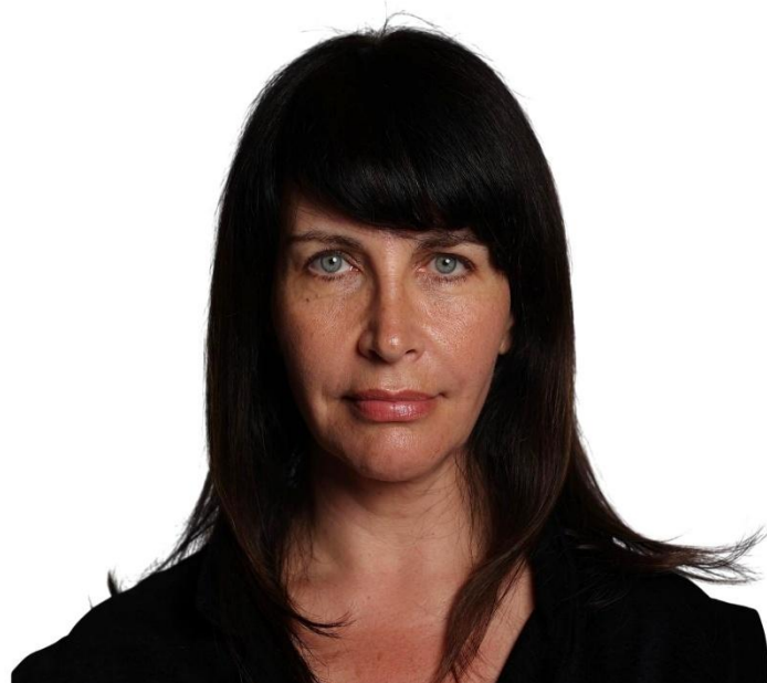
ד"ר עינת וילף, יו"ר מפלגת עוז

אנחנו לא מבטיחים ניסים בקדנציה אחת, אלא מנהיגות עם חזון חיובי שתשים את ישראל על המסלול הנכון לטווח הארוך.